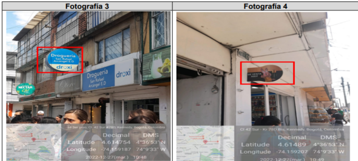
Fotografías 3 y 4 en la cual se evidencia dos (2) Avisos saliente de la fachada